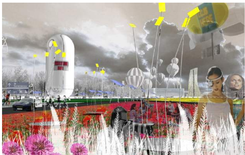
Imágenes Chora Architecture